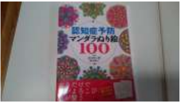
↑こちらは「マンダラぬり絵」