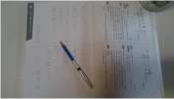
↑中はこんな感じです