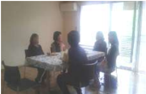
↑みなさんゆっくり過ごされています