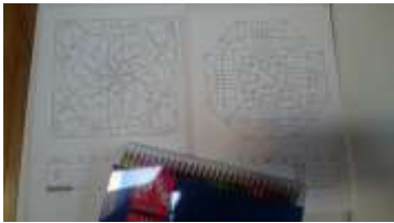
↑見た目は難しそうですね