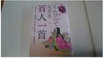
↑「えんぴつでなぞる百人一首」