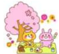
桜が咲いているといいですね

その他、各自好きな物をお持ちいただいてもかまいません。 ★当日は、スペース開放日ですので、どなたでもご利用 できます。ぜひご来所ください。