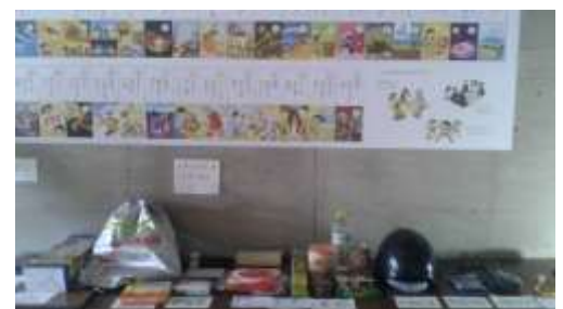
↑ 非常用持ち出し物

非常持ち出し袋・・・用意はしているのですが、中身を整えていません。皆さんはいかがですか? 防災かるたの紹介もありました。当たり前のことが書かれています、読んでみると再確認ができ勉強になりました。子供さんやお孫さんと、このかるたをしながら知識、意識をつけるのも有効だと思いました。