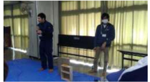
↑ 大分大学の学生さん達

地震の知識や非難についてのクイズが出され、手元のボタンで答えていきましたが、殆ど正解できませんでした(汗)。皆さん、避難場所をご存知ですか?そこまで行くのにも崖崩れの可能性もあるので、広い道を通った方がいいようです。バス通りを通って敷戸小学校へ、も考えておいた方がいいと思いました。統計から南海トラフ地震は30~50年(だったかな??)のうちに起こる可能性は高いそうです。