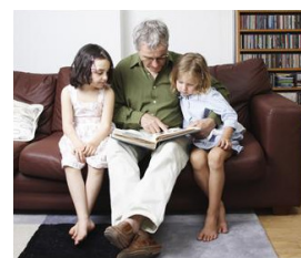
※写真やイラストはすべてイメージです