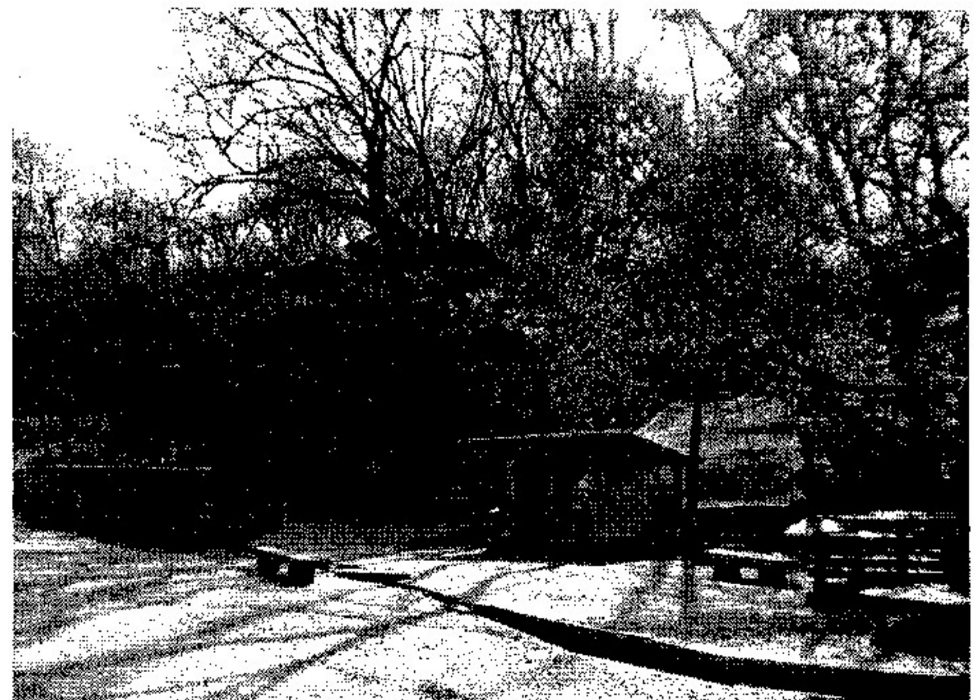
雑木林のなかのゴジカラ村